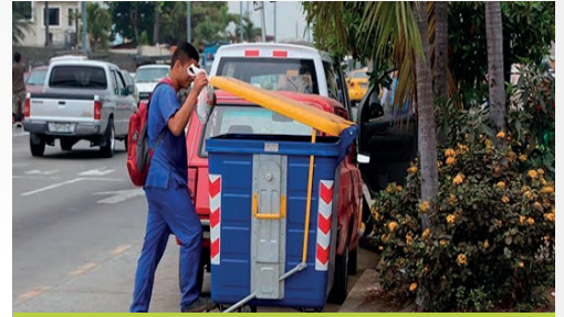
GAD MUNICIPAL DE BABAHOYO