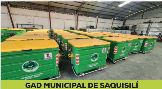
GAD MUNICIPAL DE SAQUISILÍ