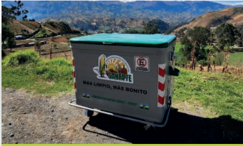
SANTA FE - GUARANDA