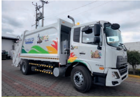
GAD MUNICIPAL DE LORETO