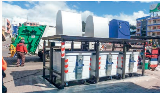
GAD MUNICIPAL DE GUARANDA