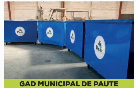
GAD MUNICIPAL DE PAUTE