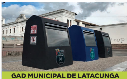
GAD MUNICIPAL DE LATACUNGA