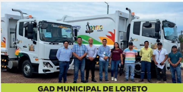
GAD MUNICIPAL DE LORETO