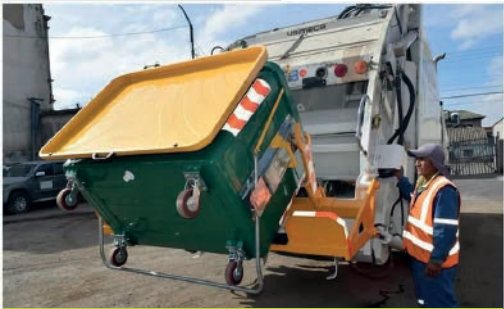
GAD MUNICIPAL DE SAQUISILÍ