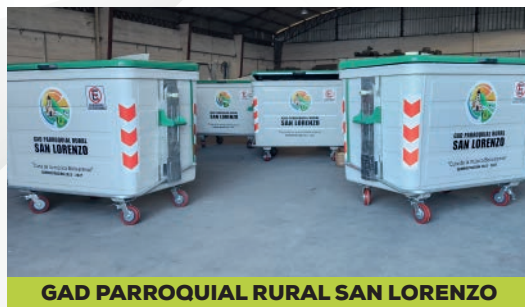
GAD PARROQUIAL RURAL SAN LORENZO