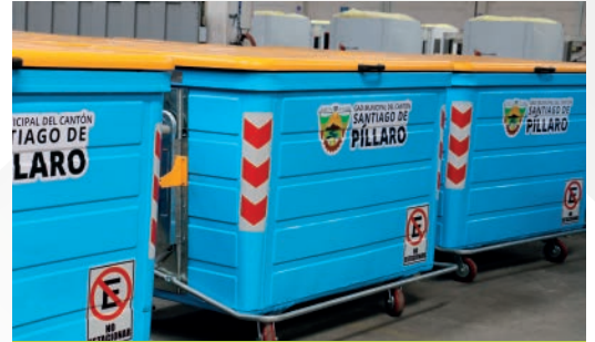
GAD MUNICIPAL DE SANTIAGO DE PILLARO