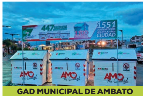
GAD MUNICIPAL DE AMBATO