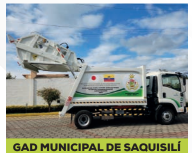
GAD MUNICIPAL DE SAQUISILÍ