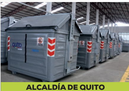
ALCALDÍA DE QUITO