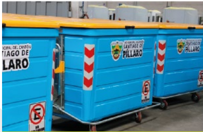
GAD MUNICIPAL DE SANTIAGO DE PÍLLARO