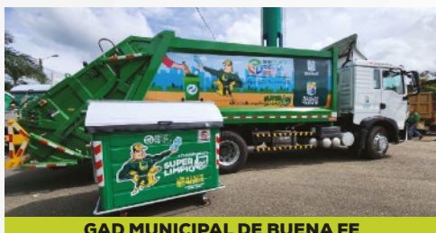
GAD MUNICIPAL DE BUENA FE