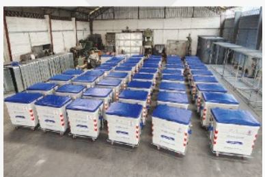
GAD MUNICIPAL DE SALCEDO