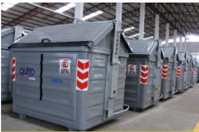
ALCALDÍA DE QUITO