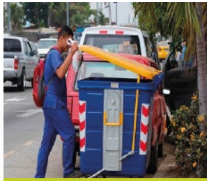
GAD MUNICIPAL DE BABAHOYO