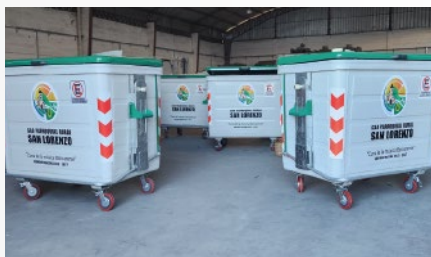
GAD PARROQUIAL RURAL SAN LORENZO