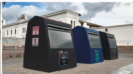
GAD MUNICIPAL DE LATACUNGA