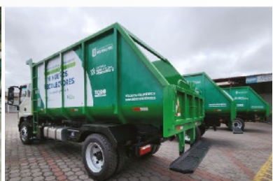
GAD MUNICIPAL DE MÓNTECRISTI