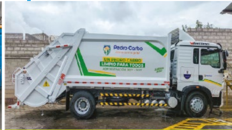
GAD DE PEDRO CARBO