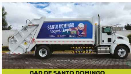
GAD DE SANTO DOMINGO