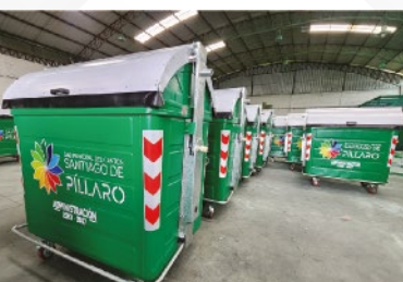
GAD MUNICIPAL DE PÍLLARO