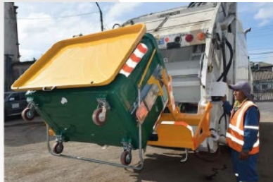
GAD MUNICIPAL DE SAQUISILÍ