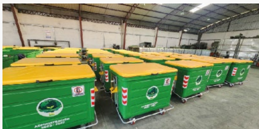
GAD MUNICIPAL DE SAQUISILÍ