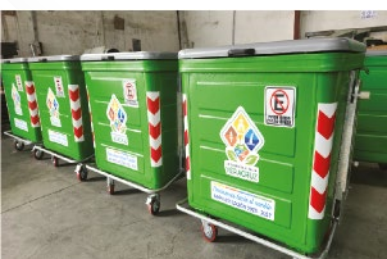
GAD DE VERACRUZ