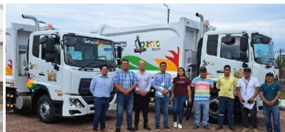
GAD MUNICIPAL DE LORETO