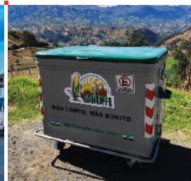
SANTA FE - GUARANDA