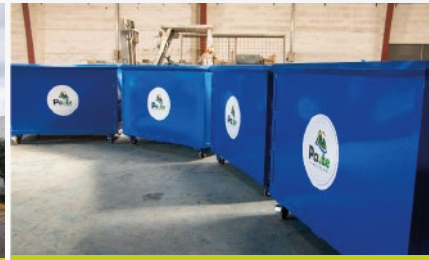
GAD MUNICIPAL DE PAUTE