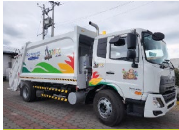
GAD MUNICIPAL DE LORETO