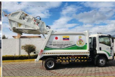
GAD MUNICIPAL DE SAQUISILÍ