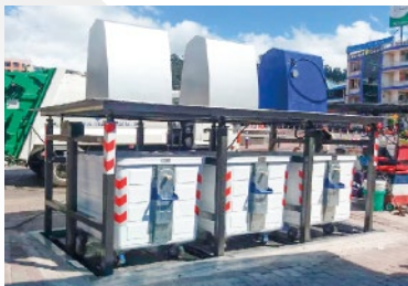
GAD MUNICIPAL DE GUARANDA