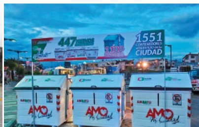
GAD MUNICIPAL DE AMBATO