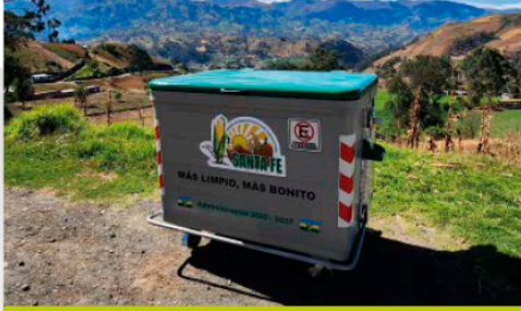
SANTA FE - GUARANDA