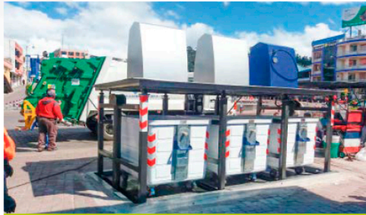
GAD MUNICIPAL DE GUARANDA