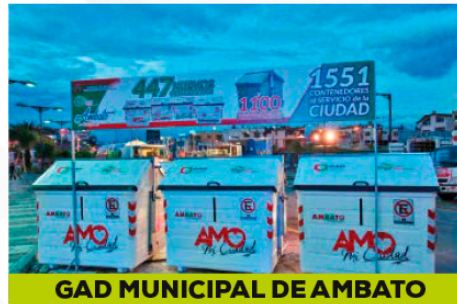
GAD MUNICIPAL DE AMBATO