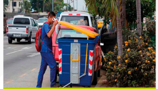
GAD MUNICIPAL DE BABAHOYO