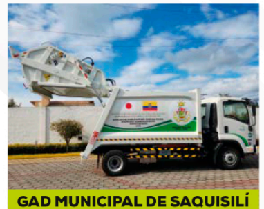
GAD MUNICIPAL DE SAQUISILÍ