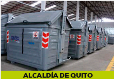
ALCALDÍA DE QUITO