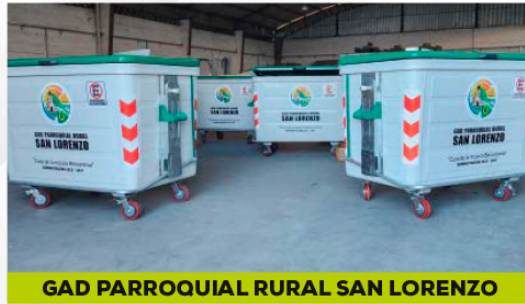
GAD PARROQUIAL RURAL SAN LORENZO