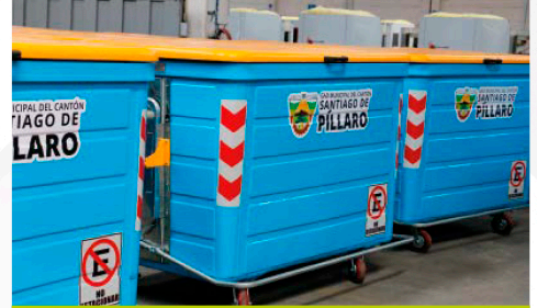
GAD MUNICIPAL DE SANTIAGO DE PILLARO