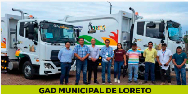
GAD MUNICIPAL DE LORETO