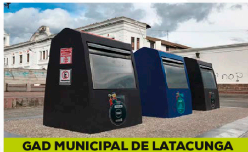
GAD MUNICIPAL DE LATACUNGA