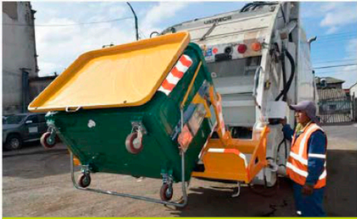
GAD MUNICIPAL DE SAQUISILÍ