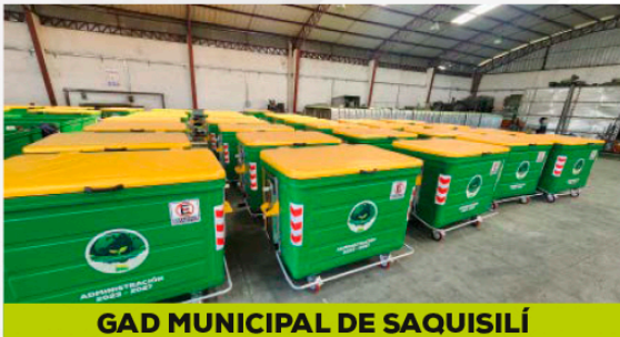
GAD MUNICIPAL DE SAQUISILÍ