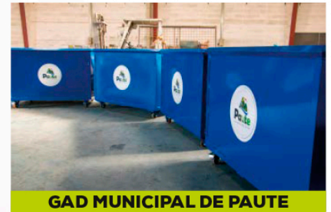
GAD MUNICIPAL DE PAUTE