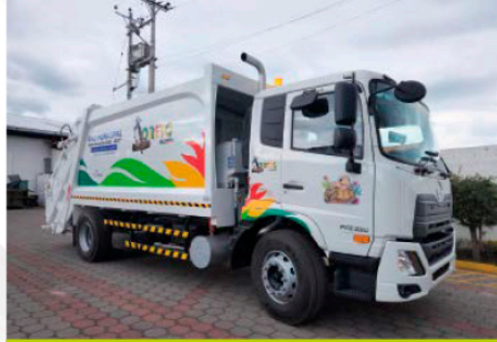
GAD MUNICIPAL DE LORETO